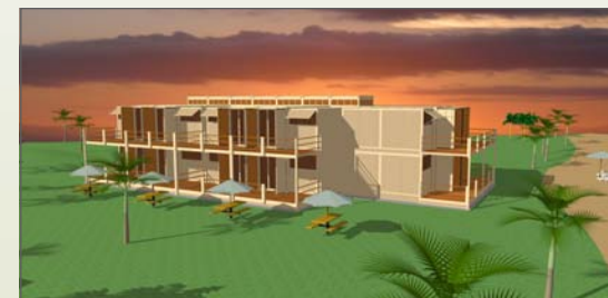
带装修设施排屋：二层5个双人房（56平方米）