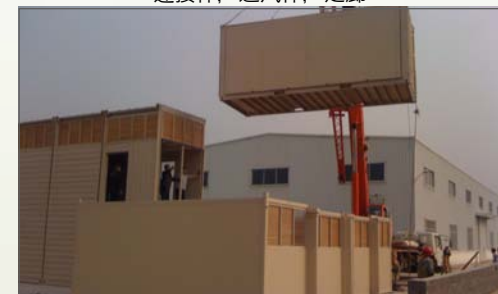
2010年在中国制造工厂的施工现场进行吊装