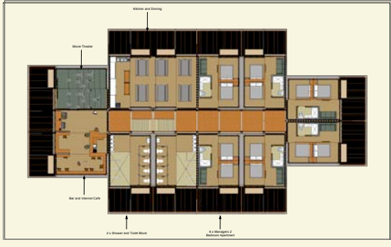
150人建筑工人宿舍方案

员工寝室、经理房、影剧院 & 酒吧、办公室、迎宾处、 厨房 & 食堂、客厅 & 储藏室