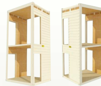
连接体，通风体，走廊